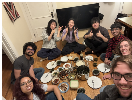
友人とのリフレッシュの時間